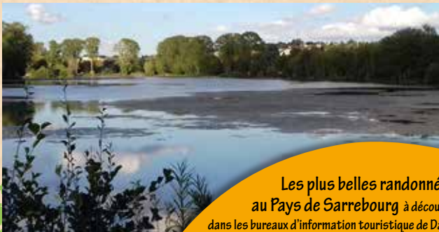
L'étang de Sarrebourg

Hoff : l'ancien village de Hoff est dénommé sur les cartes anciennes: der Hoff an der Saar, « la ferme sur la Sarre », qui lui a donné son nom Hoff, aujourd'hui devenu un quartier de Sarrebourg suite à la fusion des deux communes en 1953.