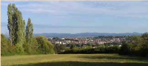
Sarrebourg et en arrière plan le Massif des Vosges

Le sentier circulaire de la Sarre permet de passer dans Sarrebourg à l'emplacement même du pont primitif de l'époque gallo-romaine, temps où la localité se dénommait Pons Saravi : le pont de la Sarre.