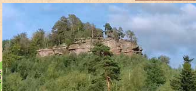
La Roche du Diable