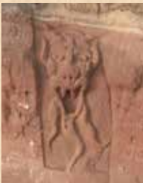
Visage du diable sculpté dans la roche

La Gloriette a été construite par le Club Vosgien de Sarrebourg-Abreschviller.